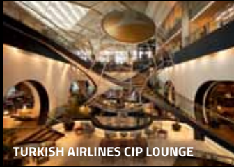
TURKISH AIRLINES CIP LOUNGE