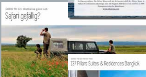
GOOD TO GO: Weltreise ganz nah Safari gefällig?