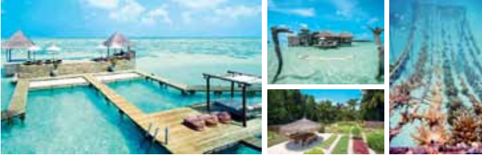
GÜL LANKAFIŞLI, MALEDIVEN